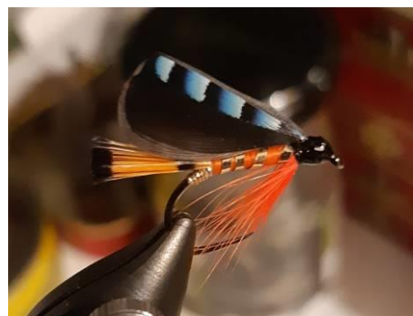
A gauche, en haut, la Coachman et en bas la Leadwing Coachman. A droite la Blue Jay.